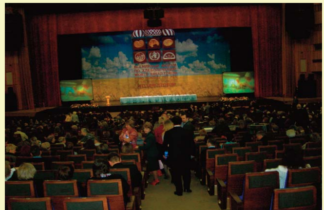
I Foro Mundial del Pan, Moscú Abril 2007

2007), que coincidió con un multitudinario I FORO MUNDIAL DEL PAN, organizado en el Palacio de Congresos del Kremlin por el Presidente de la Federación Rusa, Yuri KATSNELSON y su esposa Elena BEIZEROVA. El Presidente KOLKMAN se desplazó a muchos países para dar a conocer la UIB e impulsó los Con-